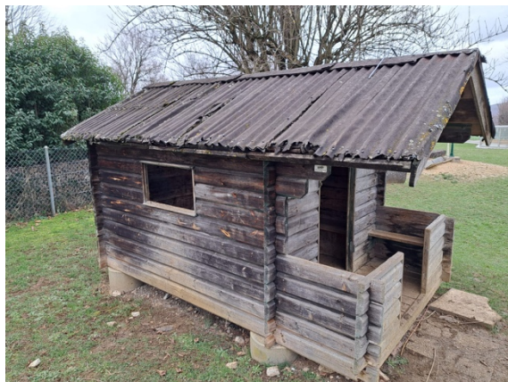
Spielhaus kann saniert und integriert werden