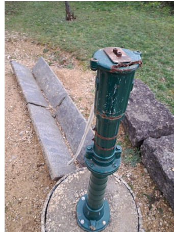
Wasserpumpe ist defekt