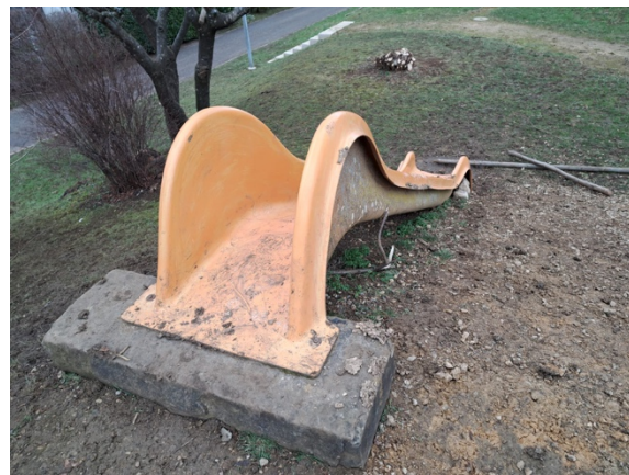
Rutsche wird ersetzt