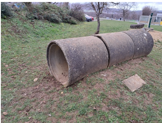
Betonrohr wird entsorgt