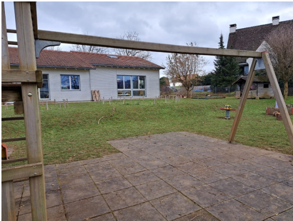
Schaukeln sind bereits ausser Betrieb

Aufgrund des hohen Alters der Spielgeräte, sowie ausbleibender Sanierungsarbeiten in den letzten Jahren, hat der Spielplatz stark an Attraktivität verloren und entspricht nicht mehr den aktuellen Sicherheitsvorschriften.