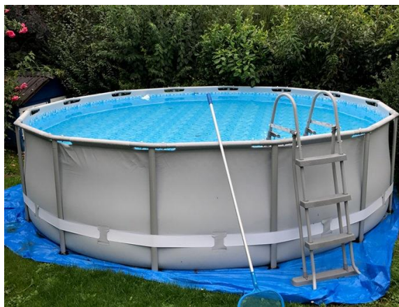
Mobil aufstellbarer Pool im Garten